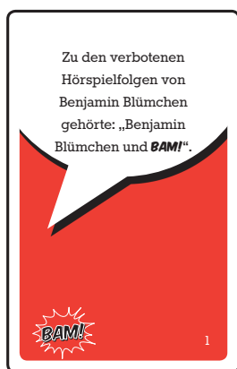
39 rote BAM! -Karten