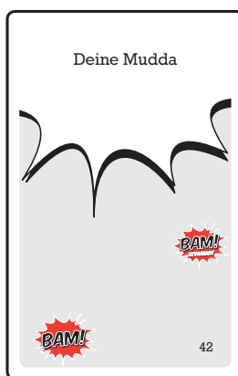
169 graue Begriffskarten