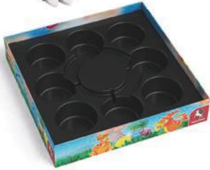
1 Schachtelunterteil mit Einsatz