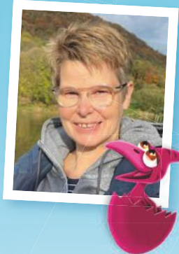
Illustration: Louis Vettesse • Realisation & Gestaltung: Mühlenkind Kreativagentur Pegasus Spiele GmbH, Am Straßbach 3, 61169 Friedberg, Deutschland © 2023 Pegasus Spiele GmbH.

Ich lebe mit meinem Mann in Porta Westfalica, bin gelernte Floristmeisterin und Mutter von drei erwachsenen Kindern. Die besten Ideen kommen mir übrigens nachts im Bett und bei neuen Projekten verheißt der Satz „Ich habe kein Auge zu getan“ meist etwas Gutes.